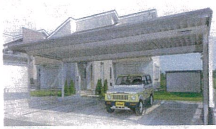
3台用 RG4L-9256 ロング 積雪50cm 間口9.170×奥行5.570×高さ3.130(mm) 完成価格 1,047,200円 ※土間コンクリート・確認申請等別途

本体組立費込特価は、本体組立費・シャッター工事・運賃・諸経費です。表示価格は10%税込価格です。 ※基礎工事等の工事費及び諸官庁手数料費、確認申請料は別途必要となります。