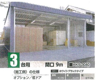
3 台用 間口 9m ■HKS-3040 (施工例)の仕様 カラー ホワイトブラックタイプ オプション/ 樞ドア