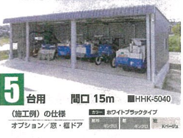
5 台用 間口 15m ■HHK-5040 (施工例)の仕様 カラー ホワイトブラックタイプ オプション/ 窓・樞ドア