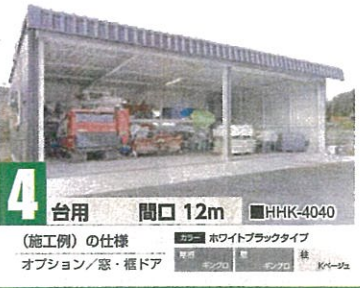
4 台用 間口 12m ■HHK-4040 (施工例)の仕様 カラー ホワイトブラックタイプ オプション/ 窓・樞ドア