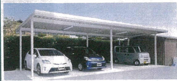
4台用 RG4L-56B×2-56 標準 積雪75cm 間口10.970×奥行5.570×高さ3.120(mm) 完成価格 1,381,490円 ※土間コンクリート・確認申請等別途