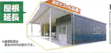
屋根延長 屋根を3mも延長!